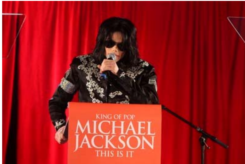
Michael Jackson

"Allenandosi nel modo corretto, Jackson potrà aumentare cinque chili in due mesi. Cinque chili di muscoli, ovviamente. Nessun trainer, nemmeno Lou Ferrigno, può fare miracoli. Ognuno si sviluppa in base alla propria genetica e Michael Jackson mi sembra troppo esile per svilupparsi più di tanto. Comunque, dovrà applicarsi seriamente, allenandosi 50 minuti al giorno, per almeno quattro giorni alla settimana. Presumo che Ferrigno darà a Jackson la scaletta dei principianti: una seduta di pesi alternata a una di aerobica, con carichi minimi. Non avrebbe senso farlo allenare in modo pesante, per il motivo che ho spiegato prima."