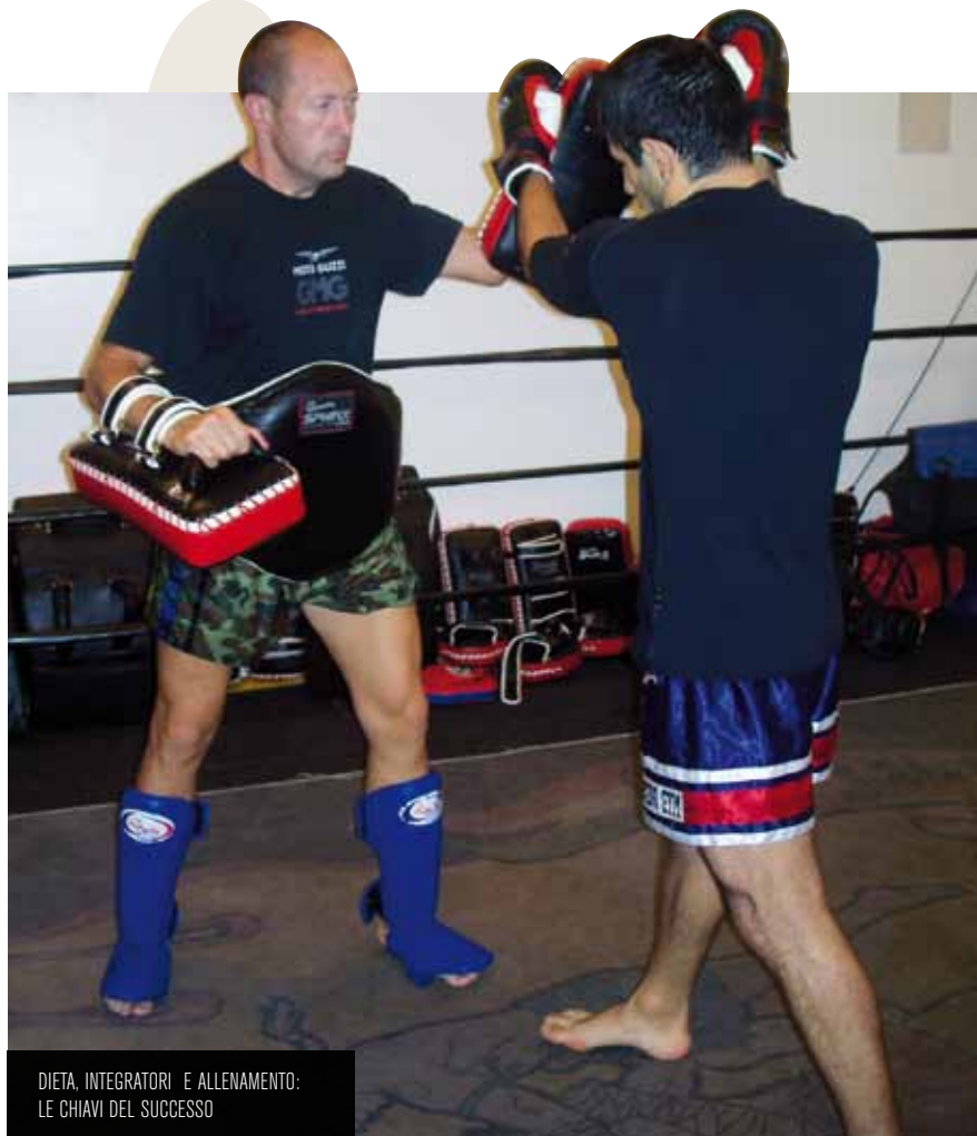
DIETA, INTEGRATORI E ALLENAMENTO: LE CHIAVI DEL SUCCESSO

Ringness: è vero che sei un vecchio praticante di arti marziali e di sport da ring in generale?