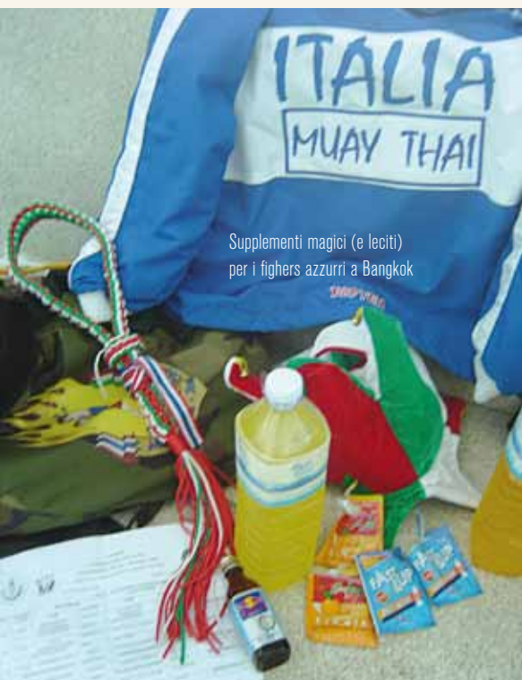
Supplementi magici (e leciti) per i fighters azzurri a Bangkok